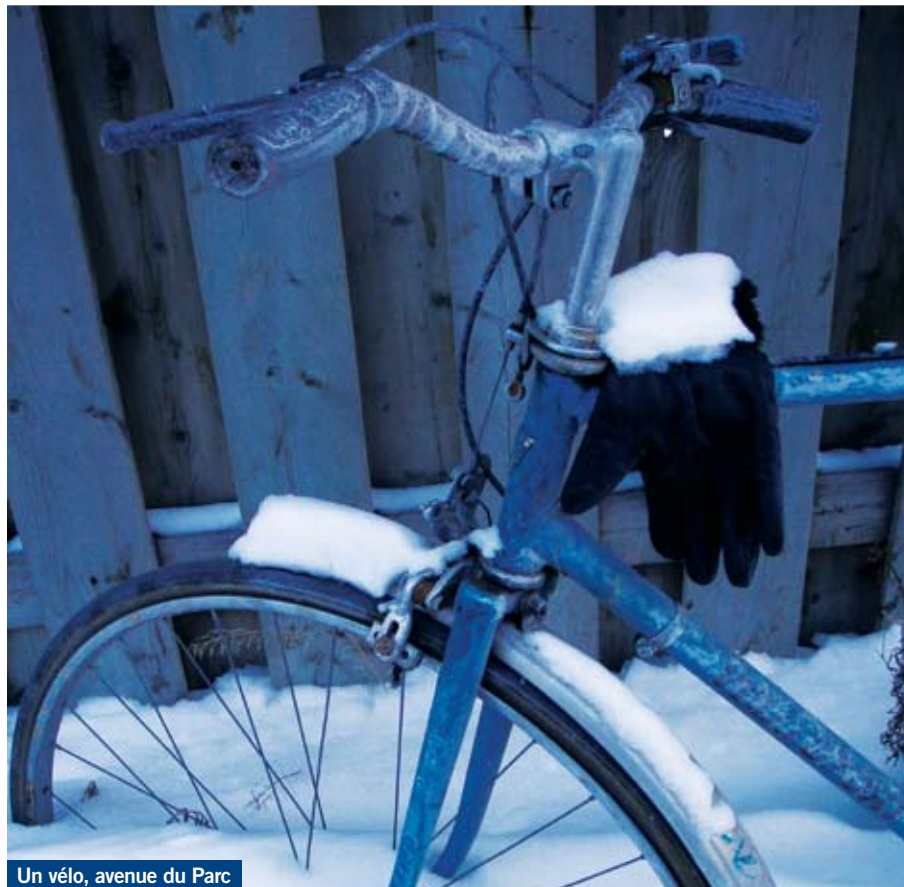
Un vélo, avenue du Parc

Un vélo abandonné, un hôpital gris, des toits de maisons bien chauffées, un parc vide, une marcheuse solitaire. Hiver urbain. ❧