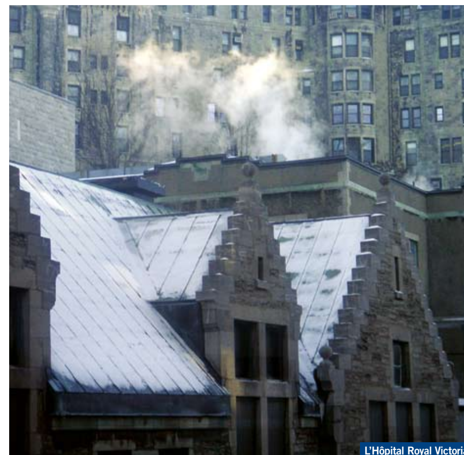
L'Hôpital Royal Victoria

M a conception de l'hiver est tout entière dans cette photo de la marcheuse du parc. Une femme seule traversant une forêt d'arbres dénudés.